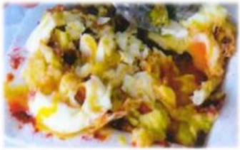
Oeufs brouillés 8,90 €