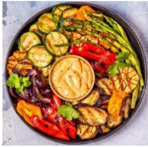
Légumes grillés 8,90€