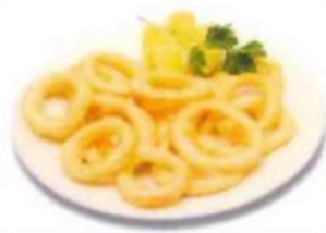
Calamars à la romaine 9,80 €