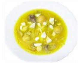
Soupe Couverte 6,00 €