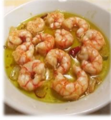
Crevettes Scampis 12.00 €