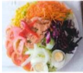
Salade mixte 6,50 €