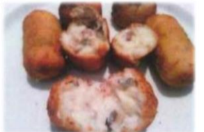
Croquettes maison 1,00 € Promotions 1,50 €