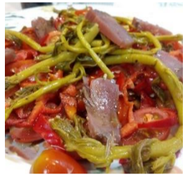
Tomate à la Bonite 9,80 €