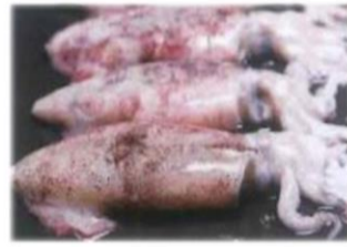
Calmar national Prix selon marché