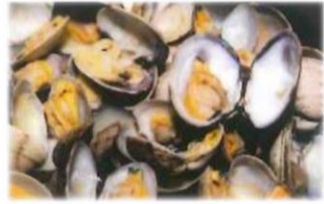
Palourdes 12,00 €