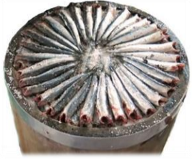
Anchois en saumure 2.50 €