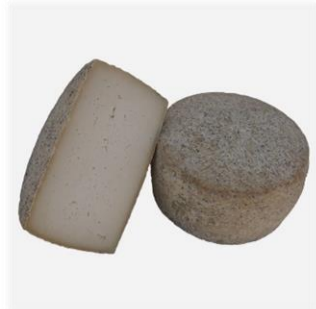
Fromage Manchego 6,00 €