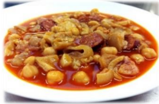
Tripes de boeuf 7,00 €