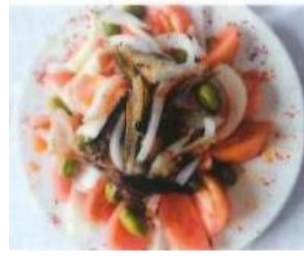
Salade d'aumônier 6,50 €