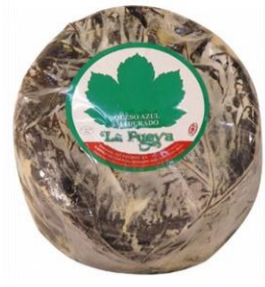
feuille de fromage bleu 7,00 €