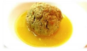
Consommé avec boule 3,50 €