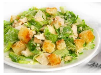
Salade cesar 9,80 €