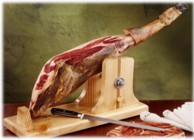
Jambon de Cave 8,90 € Jambon ibérique 14,00 €