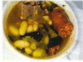
Ragoût de montagne 7,00 €