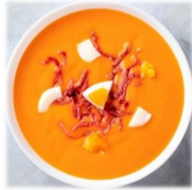
Tasse Salmorejo 4,50 €