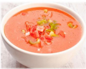
Gazpacho 4,00 €