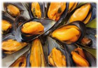
Moules 7,00 €