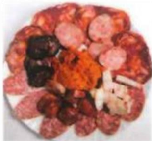
Assiette de saucisses 8.90 €